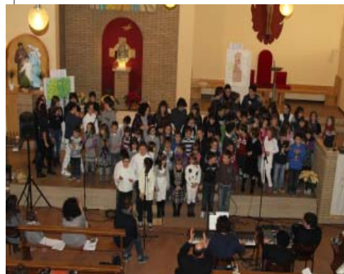
Alla Sacra Famiglia affidiamo tutti i nostri bambini, ragazzi ed adolescenti del cammino di Iniziazione Cristiana!!!