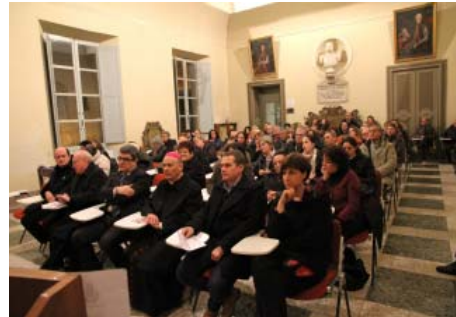
10° anniversario del Centro "La Giostra" a S. Gregorio